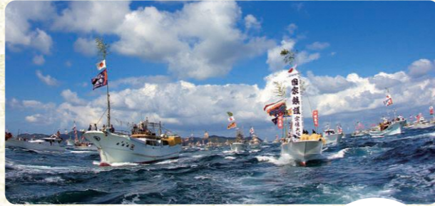
(上)沖津宮と中津宮のご神体を乗せた御座船と、数百隻のお供の漁船による海上神幸が見られる「みあれ祭」。(右)鐘崎の海面から浮き上がったとされる翁面。年に一度、面をつけた舞が奉納される。