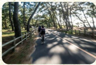
8 さつき松原 生命力みなぎる松林に囲まれたパワースポット。沖ノ島が見える日も。