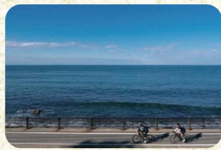
6 波津海岸・深浜 目の前に一面に広がる玄界灘。県のサイクリングロード。