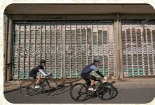
7 鐘崎漁港 県内一の漁獲高を誇る鐘崎漁港。近くの活魚センターで魚を購入可。