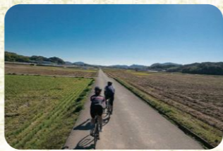
4 吉田ダム付近 吉田ダムをぬけたのどかな田園。一直線に続く道を爽快に走ろう。