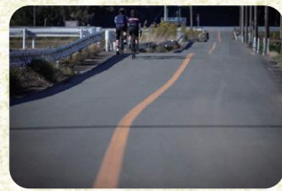
5 池田 県道502号線に続く道。うねうねした道がおもしろい。