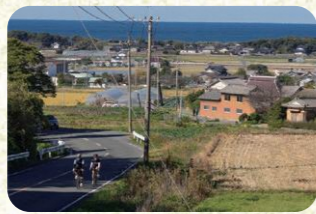
2 県道502号線 県道502号線から見下ろすのどかな街並み。