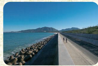
1 神湊堤防 神湊堤防沿いに広がる海がきれい。夏季は海水浴で賑わう。