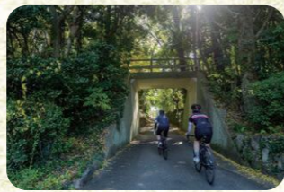
3 田島 宗像大社高宮祭場に続く橋の下をくぐる。神聖な気分を味わえる。