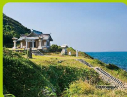
宗像大社沖津宮遙拝所